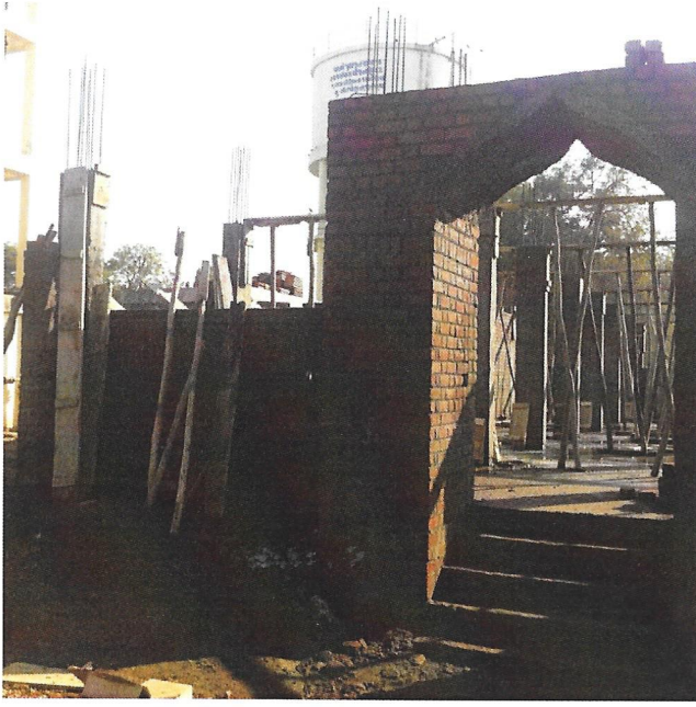
Washing Platform under construction